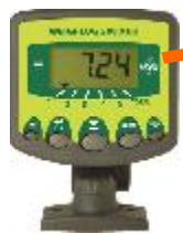
Anzeige in der Kabine